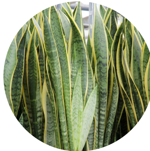
Espada de São Jorge Sansevieria trifasciata