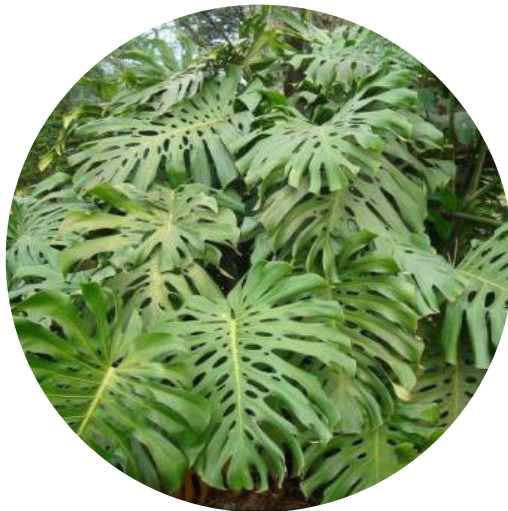
Costela-de-adão Monstera deliciosa